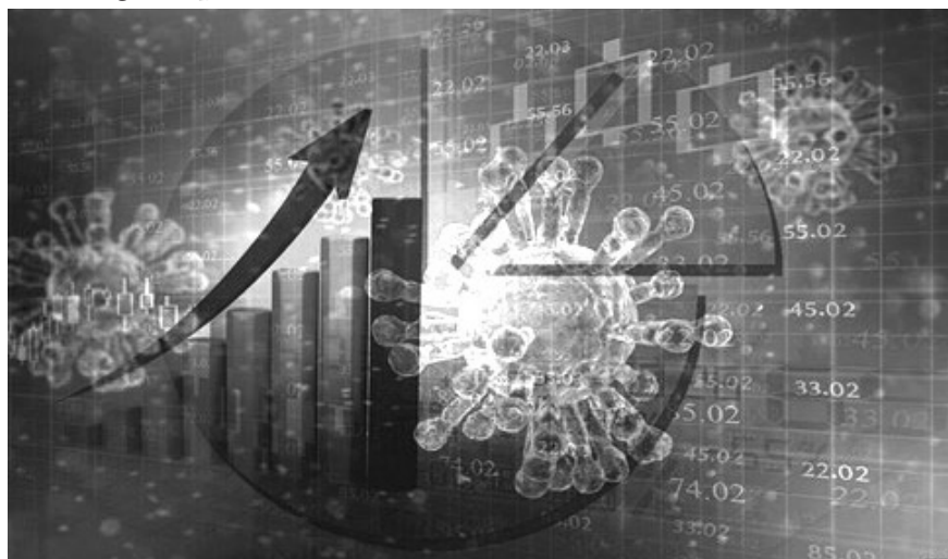
Fig. 2 Reprezentare COVID19

Criza COVID-19 a avut un impact major asupra sănătății publice 4 , economiilor globale, sistemelor de sănătate și modului în care oamenii trăiesc 5 și interacționează. Situația evoluează în continuare, iar măsurile și abordările pentru a gestiona pandemia continuă să fie subiectul discuțiilor și acțiunilor întreprinse la nivel internațional.